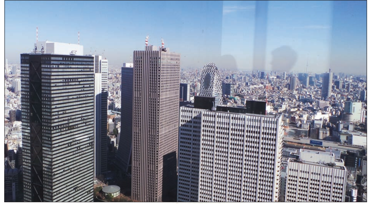
طوكيو العاصمة الرائعة.. ومدينة العمل والنظام والانضباط