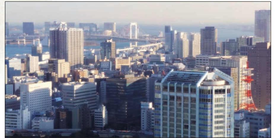
مشهد عام بجانب من العاصمة