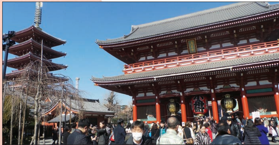
المعبد البوذي في «اساكوسا»