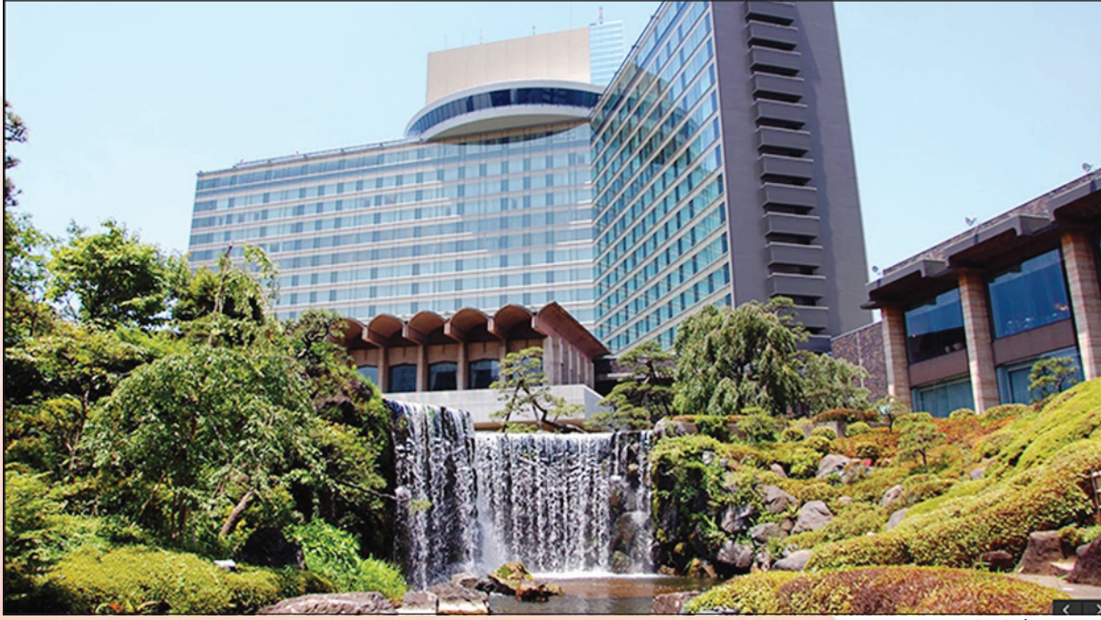
فندق «نيو أوتاني أوتيل»