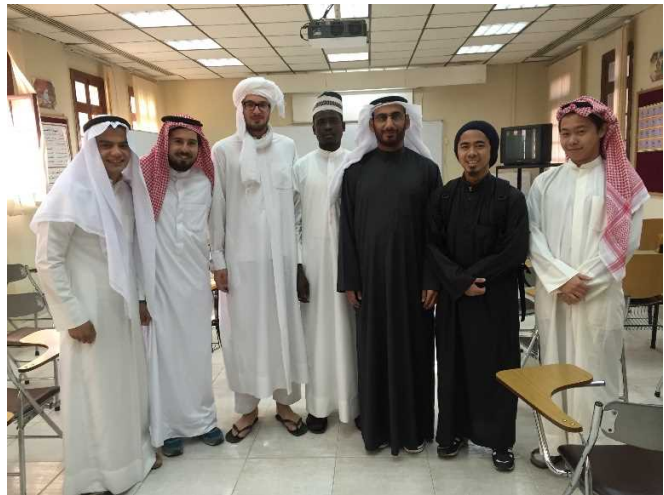
秋学期期末テスト終了後の 1 枚。

およそ 10 分のところにある語学センターでは、毎朝午前 8 時から 2 時間ほどの授業があり、そこでアラビア語や、それを通してアラブの歴史や文化を学んでいます。そして授業が終わった後、午後からは自由時間が待ち受けています。人によってこの時間の過ごし方は色々だと思いますが、私はク